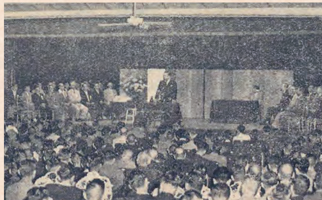
東京印刷時報 印刷文化典を報じる記事より(昭和27年 10月1日)

日印工連は昭和 41 年、「全日本印刷工業組合連合会」(全印工連)と改称。沖縄を除く 46 工組(沖縄工組は昭和 47 年に沖縄県が日本復帰を果たすとともに全印工連に加盟)による全国組織として近促法に基づく「構造改善事業」の準備を進めていくことになる。