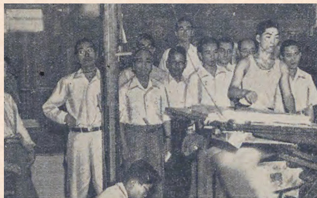
東京印刷時報 工場巡回技術指導を報じる記事より(昭和27年9月1日)

国はカルテルによる救済措置として「特定中小企業の安定に関する臨時措置法」(中小企業安定法)を制定。中小企業の比率が高く、需給バランスを欠いて事業継続に大きな影響のある業種について「調整組合」の設立を認めた。「中小企業安定法」とは生産制限に基づき、価格の安定と企業経営の安定を図る法律である。印刷業も指定業種となり、全国に調整組合が設立されていた。